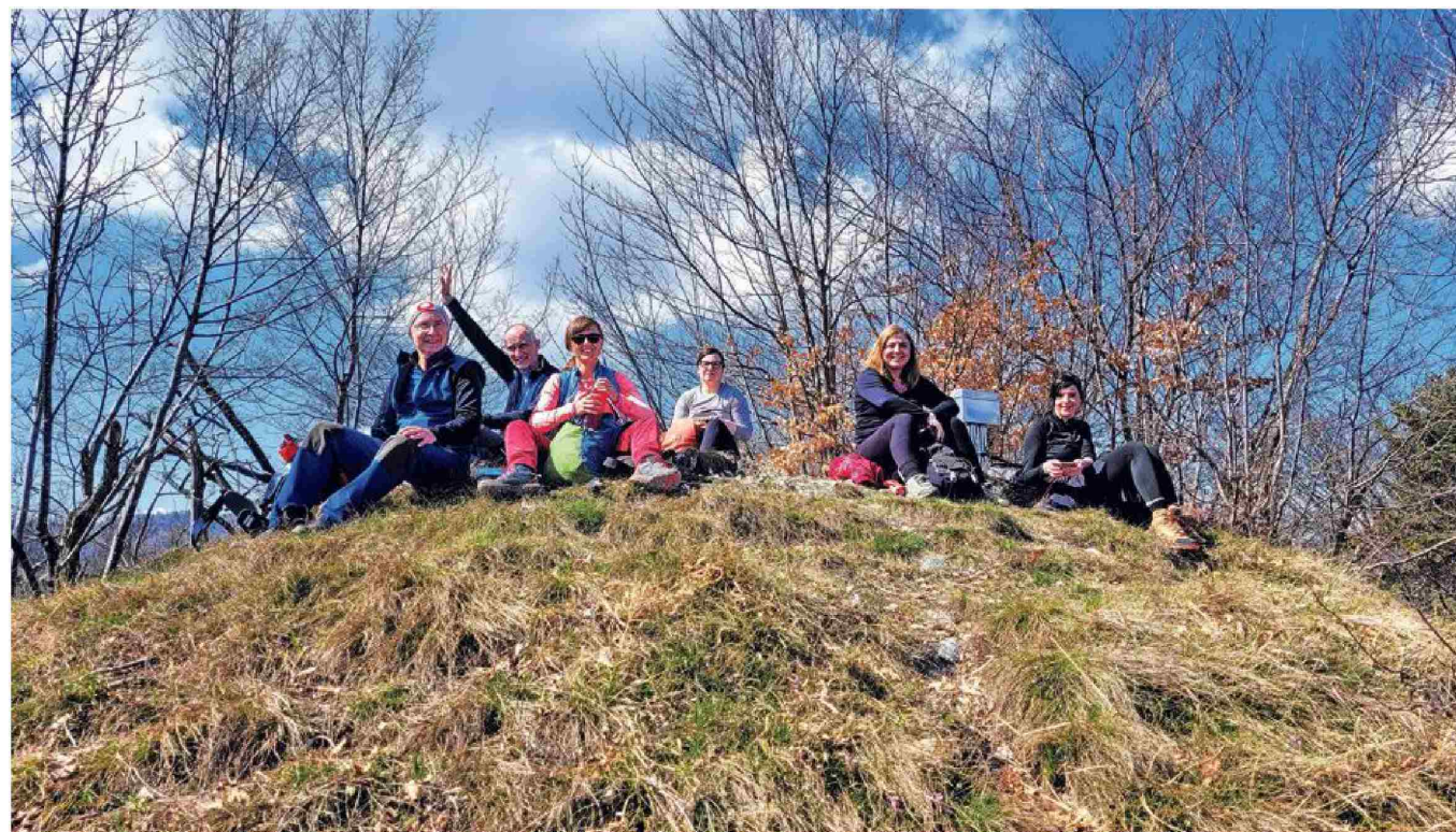
Novinarska konferenca v hribih