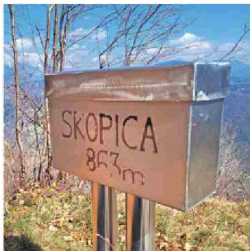
Večini neznan in zato samotni vrh Skopice

Izhodišče za turo na Skopico je prelaz Drnulk, do katerega pridemo po slikoviti cesti iz Dolenje Trebuše ali iz Čepovana. Na prelazu pustimo avto in se po gozdni cesti usmerimo do prostranih pašnikov ob nekdanjih Čepovanskih Vršah, nato se skozi bukove gozdove po kolovozih in stezicah povzpemo na vrh. Pot, ki ni ves čas označena in je zato primerna le za izkušene pohodnike, prehodimo v uri in pol.