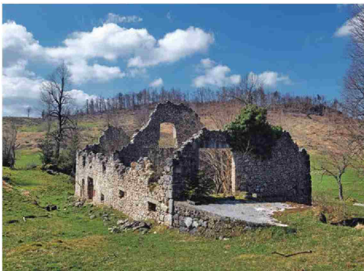
V tej hiši je do leta 1970 živel zadnji prebivalec Vrš.